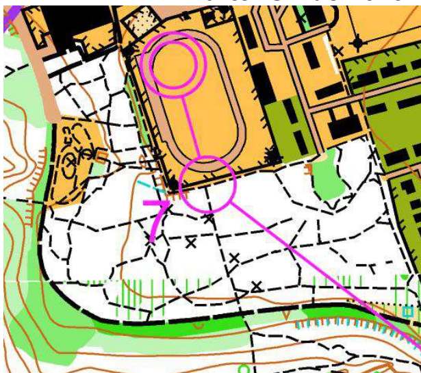
FENETRE 1 / Carte IOF de 2019